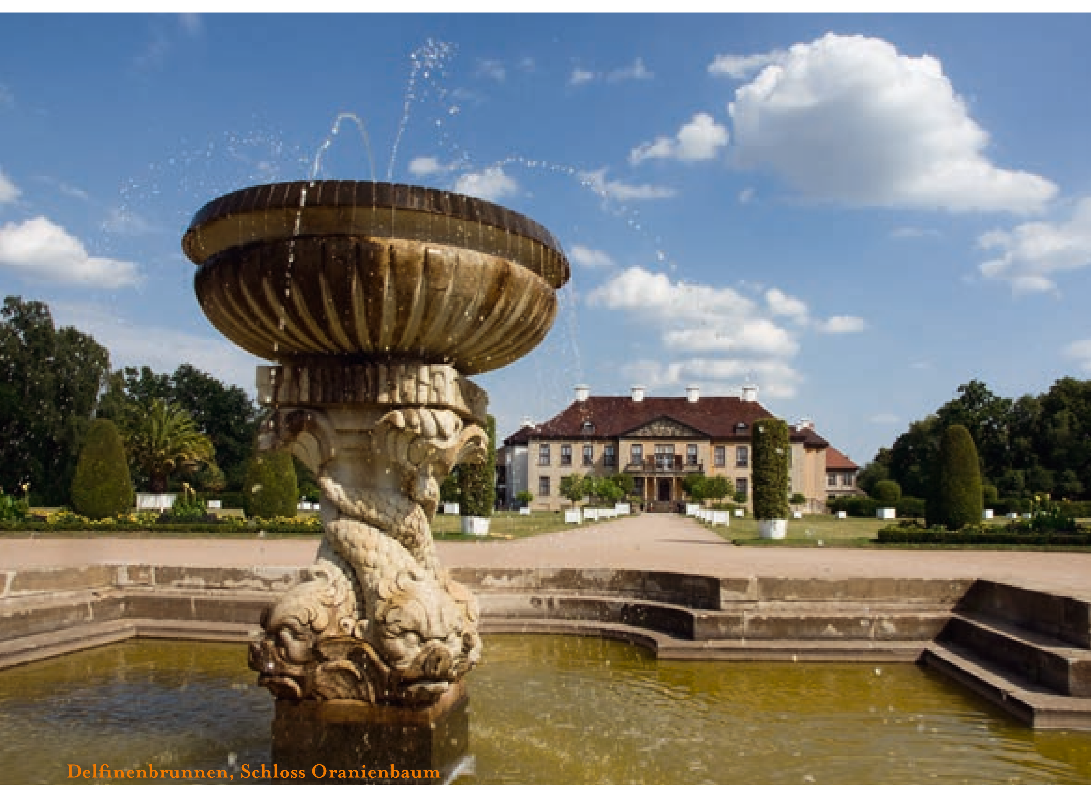
Delfinenbrunnen, Schloss Oranienbaum