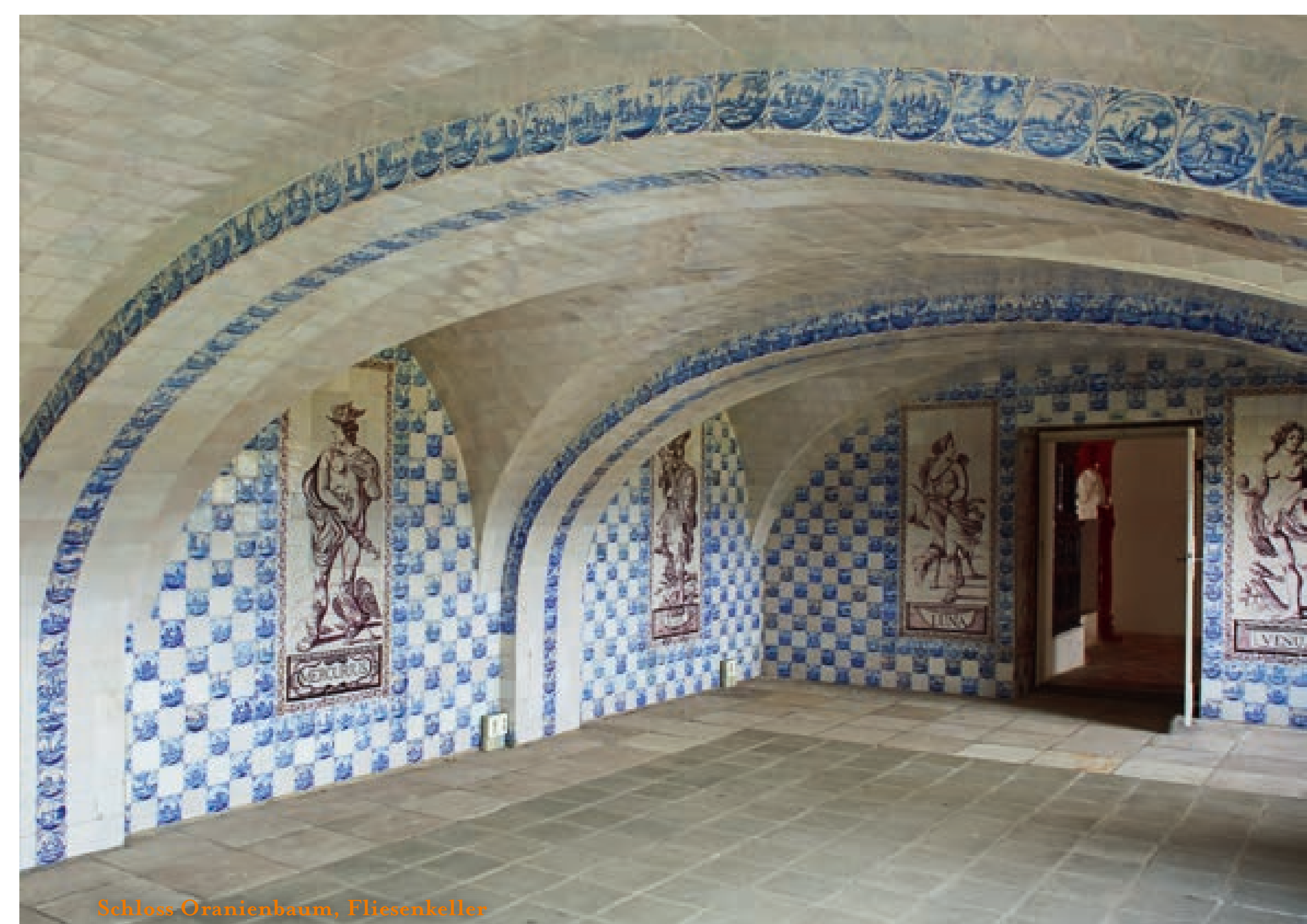
Schloss Oranienbaum, Fliesskeller