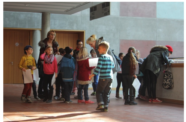
Erkundungen der ersten und zweiten Klassen im GD

http://www.europa-uni.de/de/struktur/gremien/beauftragte/familie/Internationale-Promovierende_Postdocs/Foerderung/index.html