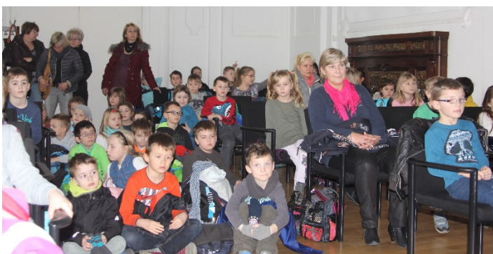
Der Senatssaal war bis auf den letzten Platz gefüllt.