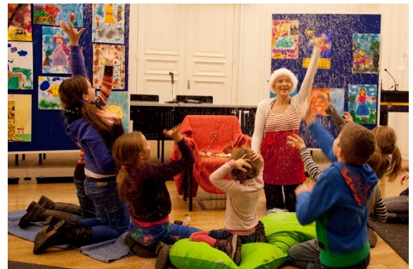
Polnische Märchenerzählung im Rahmen des lebendigen Adventskalenders an der Viadrina

Zum Jahresbeginn ist das neue Elterngeld Plus Gesetz in Kraft getreten. Neben dem bisherigen Elterngeld soll das Elterngeld Plus flexibel für diejenigen Eltern zur Verfügung stehen, die während des Elterngeldbezugs in Teilzeit arbeiten. Elterngeld Plus ersetzt den Einkommensanteil, der wegen Teilzeit entfällt. Elterngeld Plus gibt es für den doppelten Zeitraum: ein bisheriger Elterngeldmonat = zwei Elterngeld Plus-Monate. Zudem verlängert das Elterngeld Plus den Elterngeldbezug auch über den 14. Lebensmonat des Kindes hinaus. Teilen sich Vater und Mutter die Betreuung ihres Kindes und arbeiten parallel für mindestens vier Monate zwischen 25 und 30 Wochenstunden, erhalten sie jeweils zusätzlich für vier Monate Elterngeld Plus. Außerdem wird die Elternzeit flexibler werden: Künftig können bis zu 24 Monate Elternzeit zwischen dem dritten und achten Geburtstag des Kindes ohne Zustimmung des Arbeitgebers genommen werden. Die Regelungen gelten für Geburten ab dem 1. Juli 2015. Weitere Informationen hier http://www.bmfsfj.de/BMFSFJ/familie.did=208758.html