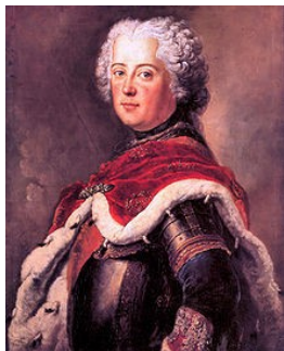
Fritz, 1740 1712-1786