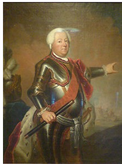
Friedrich Wilhelm I von Preußen (der Soldatenkönig), 1733 1688-1740