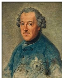
Friedrich II (der Große), 1763 1712-1786