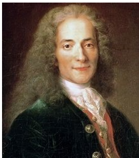
François Marie Arouet (Voltaire) 1694-1778

Ankunft Kostrzyn , Besichtigung des polnisch, preußisch- russischen Pompejis an der Warthemündung, Festung und ehemalige Altstadt