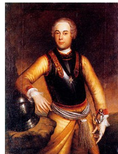
Hans Herrmann von Katte, 1729 1704-1730