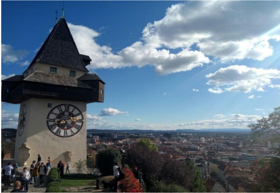
Graz (30 Fahrtminuten von Maribor entfernt)