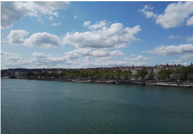
Ausblick auf die Rhone in der Nähe des Campus

Mein Fazit ist aber, dass es für Erasmus Studierende, vor allem für die, die „nur“ ein Semester bleiben definitiv schwieriger ist Zugang zu den Freundeskreisen der Franzosen zu finden. Mit Einladungen zu diversen Veranstaltungen wird nicht sparsam umgegangen. Nichtsdestotrotz bleiben diese eher unter sich. Vermutlich liegt es an dem intensiven Studienplan durch welchen auch die Erasmus Studierenden umgekehrt auch viel unter sich bleiben. Das französische Sprechen kommt daher, meiner Meinung nach, etwas zu kurz.