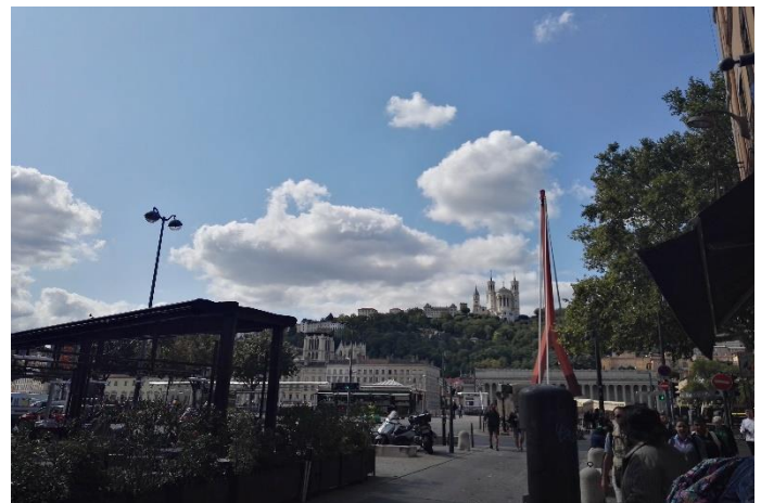
Ausblick auf die Fouvrier