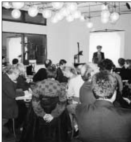
Rege Diskussion um das „Virtuelle“ bei der ersten Dozentenversammlung.

Deutlich zeigte die Diskussion, dass für die Lehrenden künftig sowohl kommunikative Online-Angebote wie auch direkte persönliche Kontakte zu dem gehören, was eine Universität ausmacht.