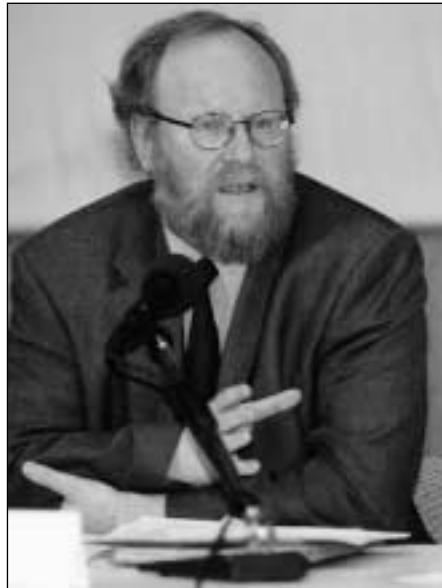
Bundestagspräsident Wolfgang Thierse.

Bundestagspräsident Thierse mahnte einen Wandel im öffentlichen Bewusstsein an, denn Rechtsradikalismus sei längst kein gesellschaftliches Randproblem mehr. Man müsse die Herausforderung annehmen, die öffentliche Debatte fördern. Es helfe gar nichts, zu sagen „Woanders ist das auch so“. Man muss HIER etwas tun und nicht der Haltung verfallen, man sei nicht zuständig, das sollen gefälligst andere regeln.