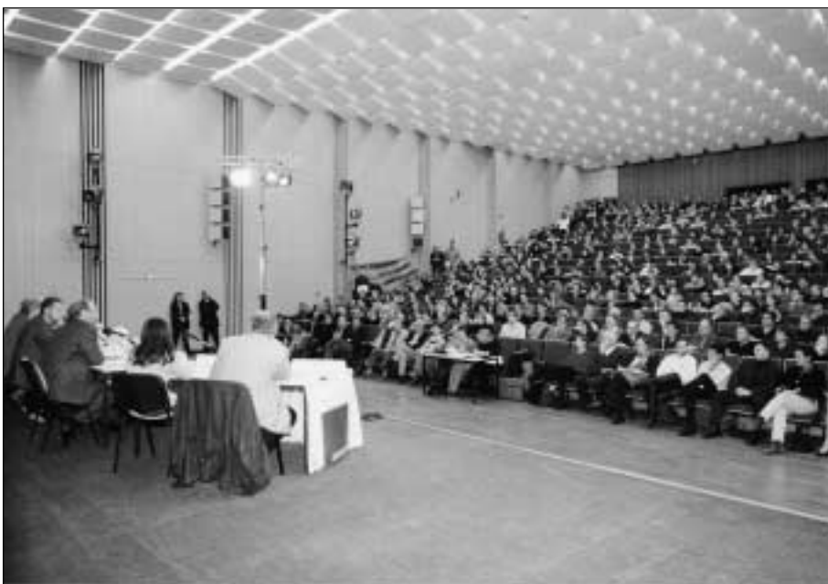
Lebendige Diskussion mit Studenten, Wissenschaftlern, Mitarbeitern und Einwohnern Frankfurts im voll besetzten großen Hörsaal der Europa-Universität.